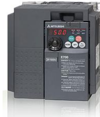
Variador de frecuencia